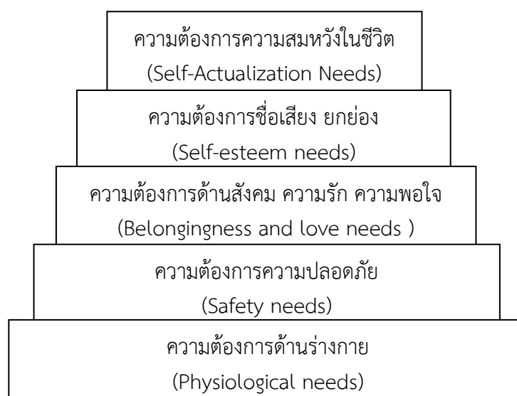
ภาพที่ ๑ ความต้องการของมนุษย์ทั้ง ๕ ขั้น ของ Maslow

๕. ความต้องการความสมหวังในชีวิต (Self-actualization needs) ความต้องการสูงสุดของมนุษย์ คือความสำเร็จในชีวิตความนึกคิดหรือความคาดหวังความทะเยอทะยาน ความใฝ่ฝัน ภายหลังจากที่มนุษย์ได้รับการตอบสนองความต้องการทั้ง ๔ ขั้น อย่างครบถ้วนแล้วความต้องการในขั้นนี้จะเกิดขึ้นและมักจะเป็นความต้องการที่เป็นอิสระเฉพาะแต่ละคน ซึ่งต่างก็มีความนึกคิด ใฝ่ฝันอยากที่จะประสบผลสำเร็จในสิ่งที่คาดหวังไว้อย่างสูงส่งในทัศนะของตน (สาวีณี แสงสุริยันตร์ และคณะ ๒๕๔๗) ดังภาพที่ ๑