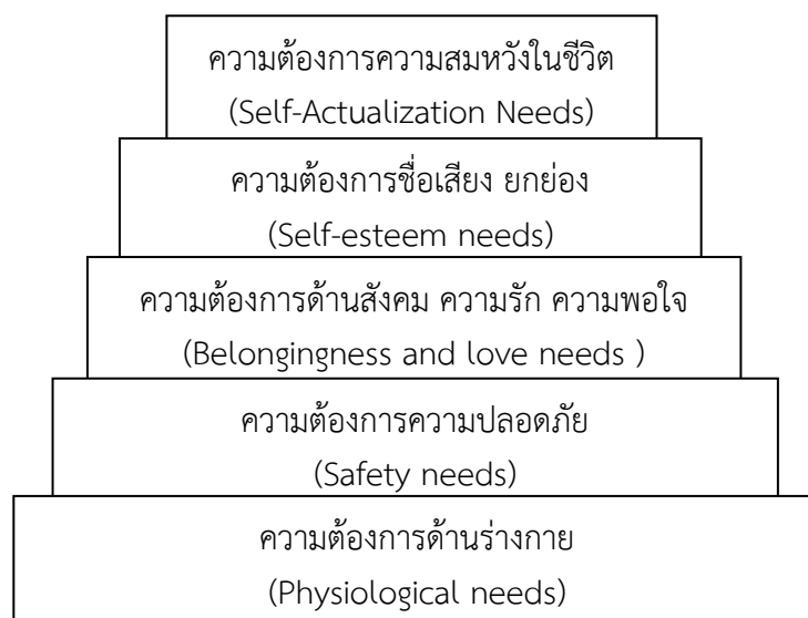
ภาพที่ ๑ ความต้องการของมนุษย์ทั้ง ๕ ขั้น ของ Maslow (ที่มา : สาวิณี แสงสุริยันตร์และคณะ, ๒๕๔๒)

๕. ความต้องการความสมหวังในชีวิต (Self-actualization needs) ความต้องการสูงสุดของมนุษย์ คือความสำเร็จในชีวิตความนึกคิดหรือความคาดหวังความทะเยอทะยาน ความใฝ่ฝัน ภายหลังจากที่มนุษย์ได้รับการตอบสนองความต้องการทั้ง ๔ ขั้น อย่างครบถ้วนแล้วความต้องการในขั้นนี้จะเกิดขึ้นและมักจะเป็นความต้องการที่เป็นอิสระเฉพาะแต่ละคน ซึ่งต่างก็มีความนึกคิด ใฝ่ฝันอยากที่จะประสบผลสำเร็จในสิ่งที่คาดหวังไว้อย่างสูงส่งในทัศนะของตน (สาวิณี แสงสุริยันตร์ และคณะ ๒๕๔๗) ดังภาพที่ ๑