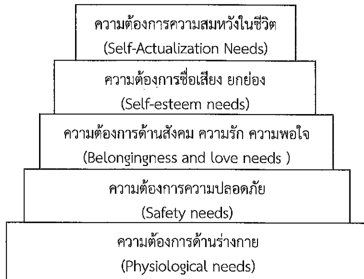
ภาพที่ ๑ ความต้องการของมนุษย์ทั้ง ๕ ชั้น ของ Maslow (ที่มา : สาวิณี แสงสุริยันตร์และคณะ, ๒๕๔๒)

๕. ความต้องการความสมหวังในชีวิต (Self-actualization needs) ความต้องการสูงสุดของมนุษย์ คือความสำเร็จในชีวิตความนึกคิดหรือความคาดหวังความทะเยอทะยาน ความใฝ่ฝัน ภายหลังจากที่มนุษย์ได้รับการตอบสนองความต้องการทั้ง ๔ ขั้น อย่างครบถ้วนแล้วความต้องการในขั้นนี้จะเกิดขึ้นและมักจะเป็นความต้องการที่เป็นอิสระเฉพาะแต่ละคน ซึ่งต่างก็มีความนึกคิด ใฝ่ฝันอยากที่จะประสบผลสำเร็จในสิ่งที่คาดฝันไว้อย่างสูงส่งในทัศนะของตน (สาวิณี แสงสุริยันตร์ และคณะ ๒๕๔๗) ดังภาพที่ ๑