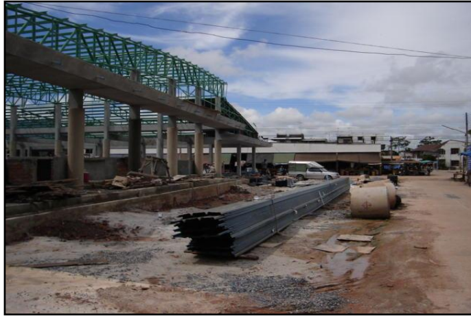
ภาพที่ ๒ : แสดงการดำเนินการปรับปรุงก่อสร้างอาคารตลาดสดเทศบาลฯ หลังใหม่

การดำเนินการก่อสร้างอาคารตลาดสดเทศบาลฯ หลังใหม่ แทนอาคารไม้หลังเก่า