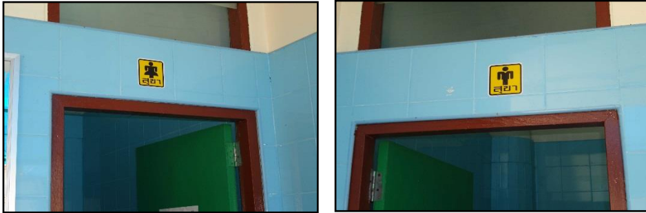
ภาพที่ ๒๓ : แสดงห้องสุขาชาย – หญิง แยกออกจากกันชัดเจน

๔.๑ การให้บริการห้องสุขา ตลาดสดเทศบาลฯ ได้แยกห้องสุขาชาย – หญิง ออกเป็นสัดส่วน