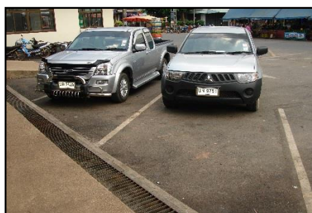
ภาพที่ ๑๗ : แสดงสถานที่จอดรถบริเวณตลาดสดเทศบาลฯ