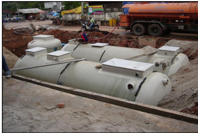
ภาพที่ ๓ : แสดงการติดตั้งระบบบำบัดน้ำเสีย แบบ Activated Sludge

การติดตั้งระบบบำบัดน้ำเสียที่สามารถบำบัดน้ำเสียได้ ๑๐๐ ลบ.ม./ วัน ระบบบำบัดน้ำเสียตลาดสดเทศบาลฯเป็นแบบ Activated Sludge ซึ่งให้ประสิทธิภาพ ในการบำบัดน้ำเสียได้สูงสุดในพื้นที่จำกัด โดยคุณภาพน้ำทิ้งที่ออกจากถังบำบัดอยู่ในภาวะที่ได้มาตรฐาน