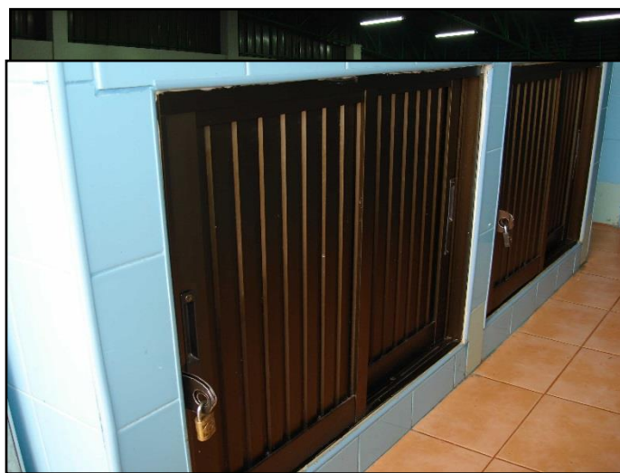
ภาพที่ ๑๒ : แสดงการจัดวางสินค้าให้เป็นระเบียบ ไม่เกะกะหรือขีดขวางทางเดิน

๑.๕ ภายในอาคารตลาดสดเทศบาลฯ ผู้จำหน่ายสินค้าแต่ละแผงจะต้องจัดเก็บสินค้า สิ่งของ และวัสดุอุปกรณ์ให้เป็นระเบียบเรียบร้อย ไม่เกะกะ หรือขีดขวางทางเดิน