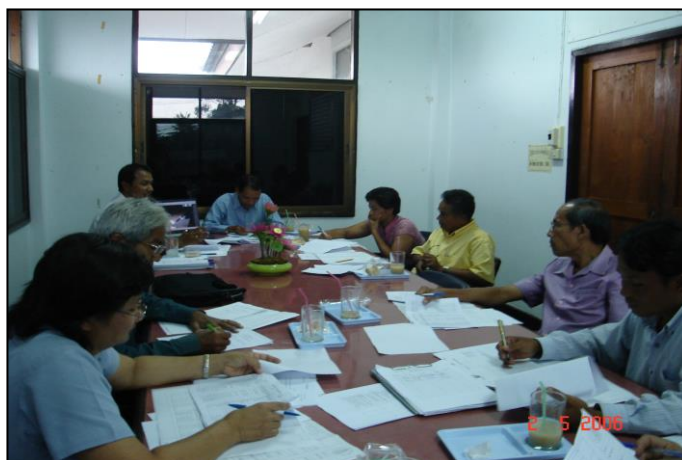
ภาพที่ ๖ : แสดงการประชุมของคณะกรรมการดำเนินงานตลาดสดเทศบาลตำบลควนขนุน

เทศบาลตำบลควนขนุน ได้แต่งตั้งคณะกรรมการดำเนินงานตลาดสดเทศบาลตำบลควนขนุน เพื่อให้การดำเนินงานบริหารตลาดสดเป็นไปด้วยความเรียบร้อย