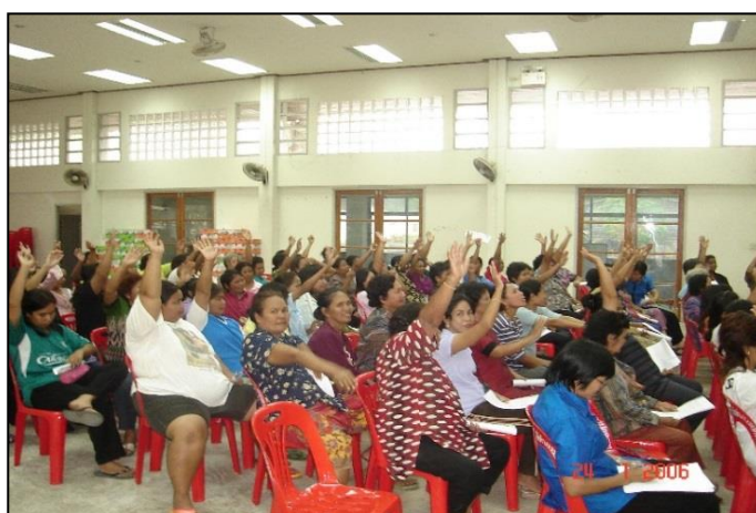
ภาพที่ ๗ : แสดงการประชุมชี้แจงผู้จำหน่ายสินค้าแต่ละประเภท

จัดประชุมชี้แจงผู้จำหน่ายสินค้าแต่ละประเภทในการจัดแบ่ง หมวดหมู่ ของสินค้าที่จำหน่าย ภายในตลาด พร้อมทั้งให้ผู้จำหน่ายสินค้ามีความเข้าใจ และปฏิบัติตามกฎระเบียบของตลาดสดเทศบาล ตำบลควนขนุน