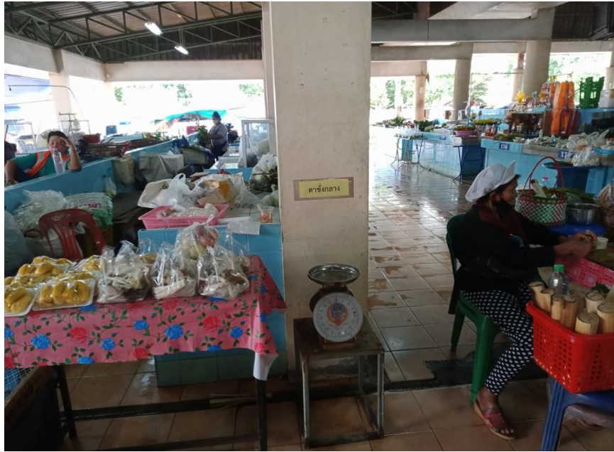
ภาพที่ ๑๑ : แสดงเครื่องชั่งกลาง

๑.๔ ตลาดสดเทศบาลฯ จัดให้มีเครื่องชั่งกลางที่ได้มาตรฐานไว้บริการผู้บริโภคในตลาดสด