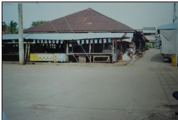
ภาพที่ ๑ : แสดงอาคารตลาดสดหลังเก่า (อาคารไม้) ก่อนการปรับปรุงก่อสร้าง

ตลาดสดเทศบาลตำบลควนขนุน ลักษณะของอาคารหลังเก่าเป็นอาคารไม้ชั้นเดียว ก่อสร้างเมื่อปี พ.ศ. ๒๕๘๖