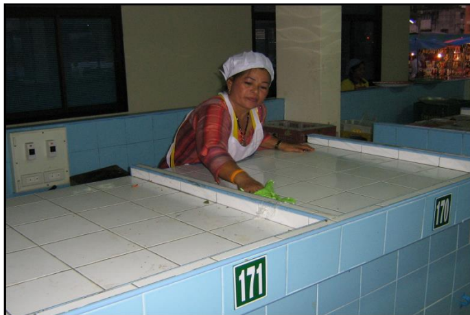
ภาพ : แสดงการเก็บ กวาด ทำความสะอาดแผง ของผู้จำหน่ายสินค้า

๒.๒ มีการจัดเก็บ ทำความสะอาด ภายในอาคารตลาดสดเทศบาล และบริเวณรอบนอกตลาด เพื่อให้มีขยะตกหล่นบนพื้นตลาด บริเวณแผง รางระบายน้ำ ทางเดิน ถนน ที่ตั้งที่พักรวมขยะมูลฝอย