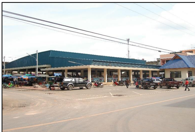
ภาพที่ ๒๑ : แสดงบริเวณรอบๆ อาคารตลาดสดเทศบาลฯ

๓.๑ บริเวณบนอาคารตลาดและรอบๆ ไม่มีน้ำขังเฉอะแฉะ