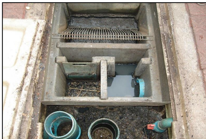
ภาพที่ ๓๐ : แสดงบ่อดักไขมัน ตลาดสดเทศบาลฯ

๔.๓ เทศบาลฯ มีระบบบำบัดน้ำเสีย บ่อดักไขมัน โดยได้มอบหมายให้ผู้ที่รับผิดชอบดูแล ตรวจสอบตรา ระบบอยู่เป็นประจำ