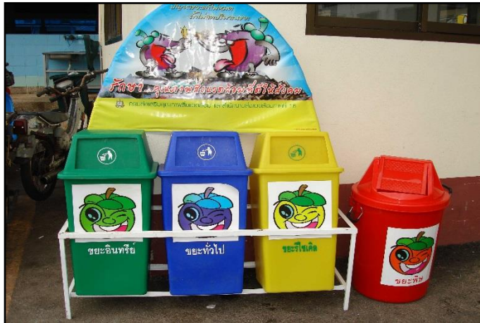
ภาพที่ ๑๘ : แสดงชุดถังขยะรีไซเคิล จัดวางไว้บริเวณตลาดสดเทศบาลฯ

๒.๑ การจัดเก็บขยะมูลฝอยภายในตลาดสดเทศบาลฯ จะดำเนินการจัดเก็บทุกวัน ในช่วงเวลา ๐๘.๓๐ น. และเวลา ๑๘.๐๐ น. โดยมีจุดรองรับขยะมูลฝอยบริเวณตลาด และบริเวณรอบๆ อาคารตลาดจะมี รางระบายน้ำที่เป็นตะแกรงเหล็ก สามารถยกเปิดทำความสะอาดได้ โดยพนักงานที่รับผิดชอบจะต้องดูแล ทำความสะอาดทุกวัน