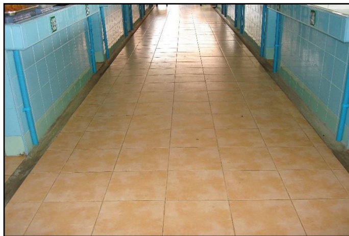
ภาพที่ ๑๔ : แสดงทางเดินภายในอาคารตลาดสดเทศบาลฯ

๑.๖ ในอาคารตลาดสดเทศบาลฯ จัดให้มีทางเดิน มีความกว้างไม่น้อยกว่า ๒ เมตร เพื่อสะดวกในการขนส่งสินค้า และเดินซื้อสินค้า