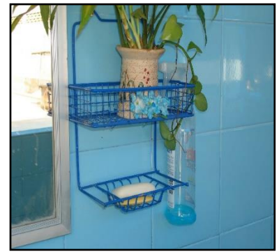
ภาพที่ ๒๕ : แสดงอุปกรณ์ต่างๆ ภายในห้องส้วม มีสภาพดีใช้งานได้