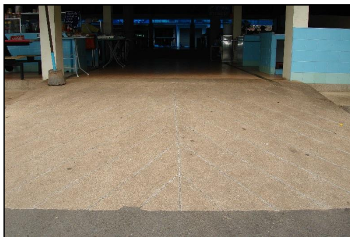
ภาพที่ ๑๕ : แสดงบริเวณทางลาด สำหรับขึ้น - ลง ภายในตลาด

๑.๗ ตลาดสดเทศบาลฯ มีทางลาด สำหรับขึ้น-ลง บนอาคาร เพื่อให้เกิดความสะดวกสำหรับผู้จำหน่ายสินค้า ผู้ซื้อสินค้า รวมทั้งผู้สูงอายุและผู้พิการ