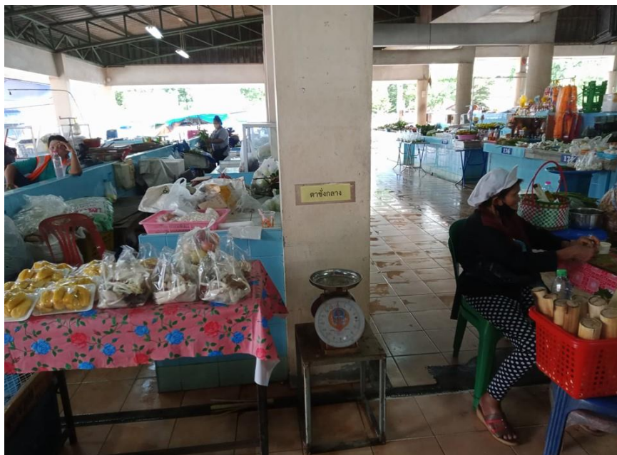
ภาพที่ ๑๑ : แสดงเครื่องชั่งกลาง

๕.๑ มีตาชั่งกลาง มีป้ายติดราคาสินค้า มีผู้ค้าและผู้ประกอบอาหารแต่งกายสะอาดเรียบร้อย