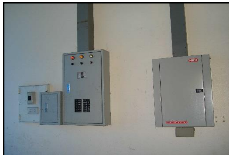
ภาพที่ ๑๖ : แสดงเครื่องดับเพลิง และ แผงควบคุมระบบไฟฟ้า

๑.๙ ตลาดสดเทศบาลฯ ได้กำหนดสถานที่จอดรถไว้ให้ผู้มาใช้บริการตลาดโดยผู้ที่มาใช้บริการ จะต้องจอดรถในสถานที่ที่ทางเทศบาลฯ กำหนดไว้