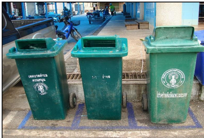
ภาพที่ ๑๙ : แสดงจุดรองรับขยะมูลฝอย